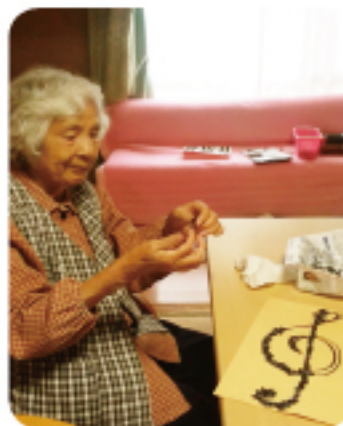
季節のカレンダー作り