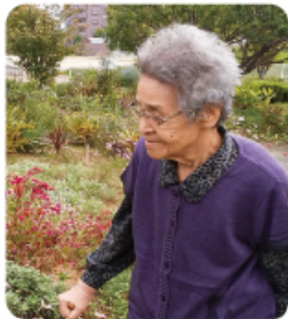
西部ふれあいセンター